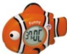
TERMOMETR PŁYWAJĄCY RYBKA Z ZEGAREM REF. 91243