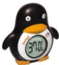
TERMOMETR PŁYWAJĄCY PINGWINEK Z ZEGAREM Z ALARMEM REF. 91424