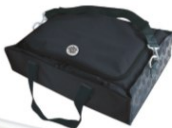
TORBA DO PRZENOSZENIA WAGI STABILITY REF. 91572