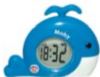
TERMOMETR PŁYWAJĄCY WIELORYB Z ZEGAREM Z ALARMEM REF. 91246