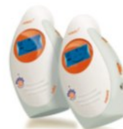
ELEKTRONICZNA NIANIA VOICE 1 REF. 91550