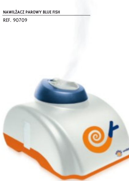
NAWILŻACZ PAROWY BLUE FISH REF. 90709