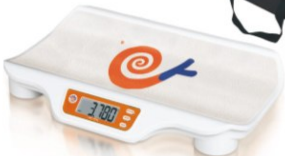
ELEKTRONICZNA WAGA STABILITY REF. 91503