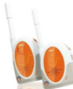
NIANIA ELEKTRONICZNA VOICE 3 REF. 91552