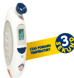
TERMOMETR ELEKTRONICZNY FLEXO REF. 91028