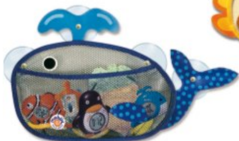
SIATKA NA ZABAWKI - WIELORYB REF. 91245

SIATKI NA ZABAWKI z przyssawkami do zamocowania na ścianie