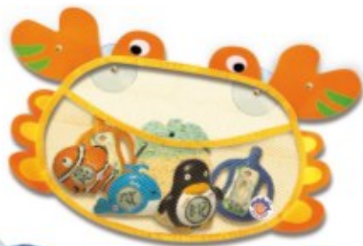
SIATKA NA ZABAWKI - KRAB REF. 91425