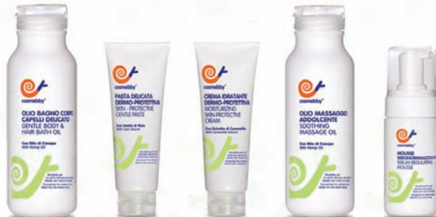
OLEJEK DO KĄPIEŁI KREM PRZECIWIŁ ODPARZENIOM NAWILŻAJĄCY KREM OCHRONNY OLEJEK DO MASAŻU PIANKA REGULUJĄCA WYDZIELANIE SEBUM